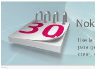
logo del nokia pc suite